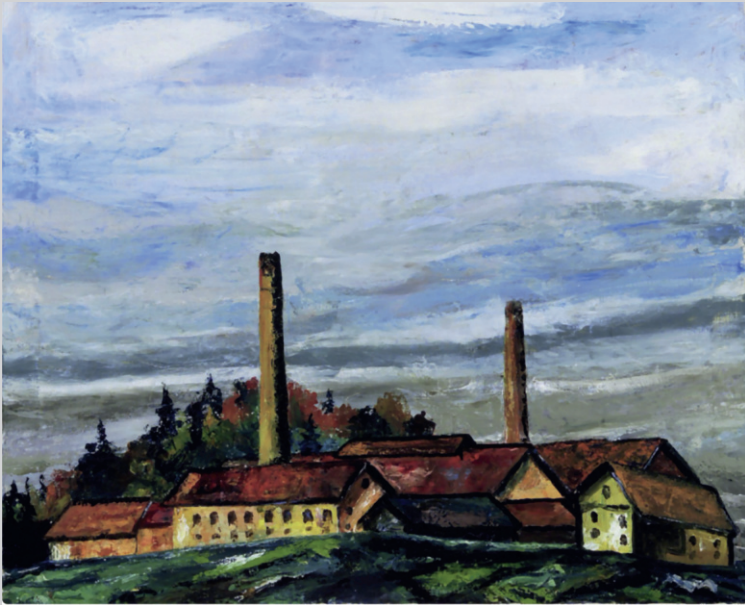
Glashütte Bürmoos, Öl auf Leinwand, Georg Rendl (1935)

1903 - 1972, Schriftsteller, Dichter, Maler und Imker